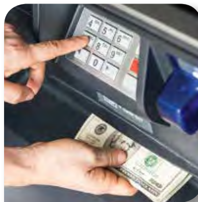
GESCHÄFTS- & GELDAUTOMATEN