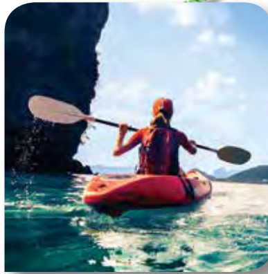
SPORT & FREIZEIT