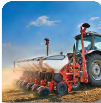
LANDWIRTSCHAFTLICHER UND NICHT-SELBSTFAHRENDER TRANSPORT