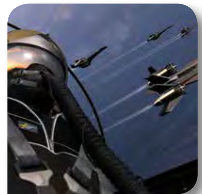
VERTEIDIGUNG & LUFT- UND RAUMFAHRT