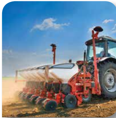
農業および自動車以外の輸送