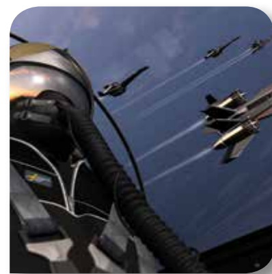
防衛および航空宇宙