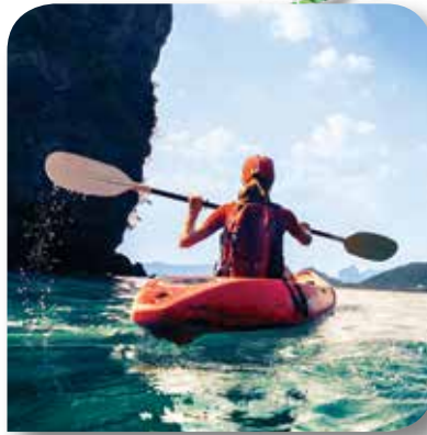
スポーツ・レジャー