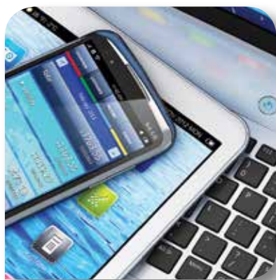
電気および電子機器